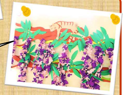
5月のデイケアカレンダーは、藤棚の上でくつろぐ猫です。