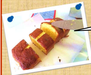
パウンドケーキを作りました。 デイケア特製マーマレード入りです。