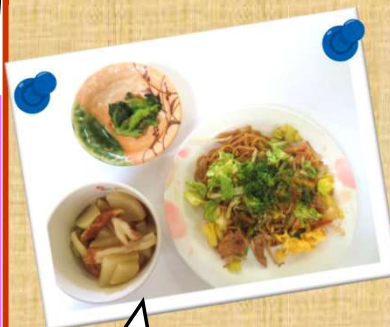
調理でやしそばを作りました。

3月から、毎週月曜午前に『自分とうまくつきあう勉強』を行います。興味のある方は、診察を担当する医師にご相談ください。デイケアに問い合わせをいただくことも可能です。みなさまのお越しをお待ちしています。