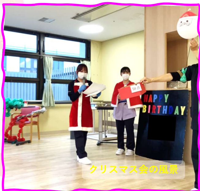
クリスマス会の風景

また、重度の知的障害と行動障害を有する児(者)を対象とした医療型短期入所においては日々、様々な行動療法や専門的アプローチを用いて行動変容のためのサポートを行っています。