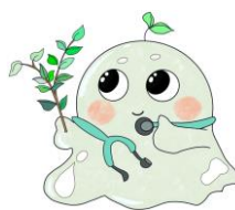
榊原病院キャラクター