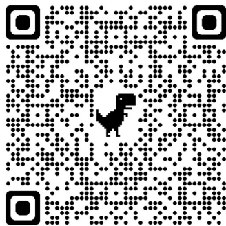
申し込みフォーム

心神喪失等で重大な他害行為を行なった者の 医療及び観察等に関する法律(医療観察法)における専門的知識や技術を学び合い 各関係機関の取り組みを共有し、相互理解・連携を促進しましょう